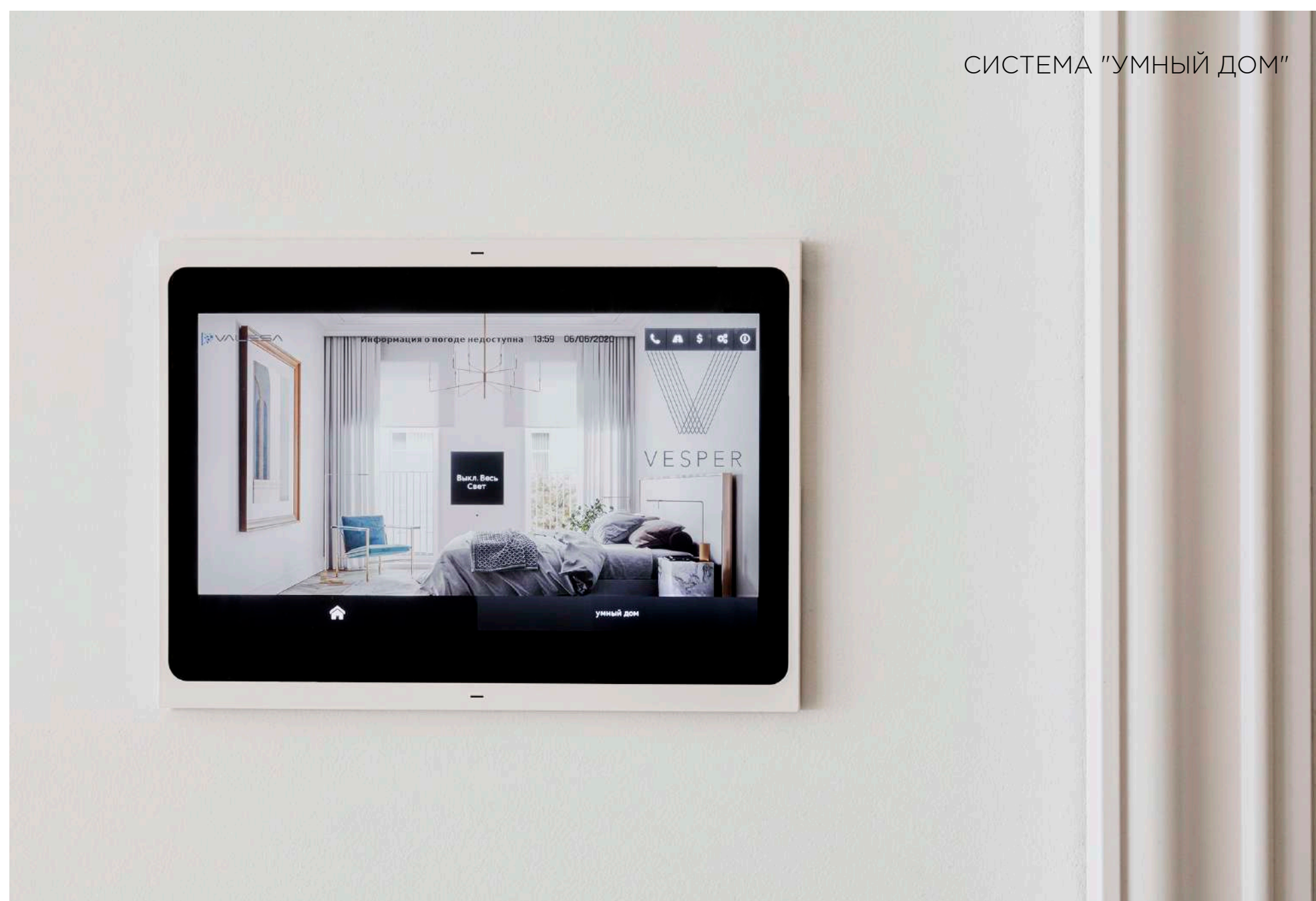
СИСТЕМА "УМНЫЙ ДОМ"

Комфорт жизни владельцев квартир обеспечивают шумопоглощающие окна, технология «умный дом» и инновационная система контроля качества воздуха.