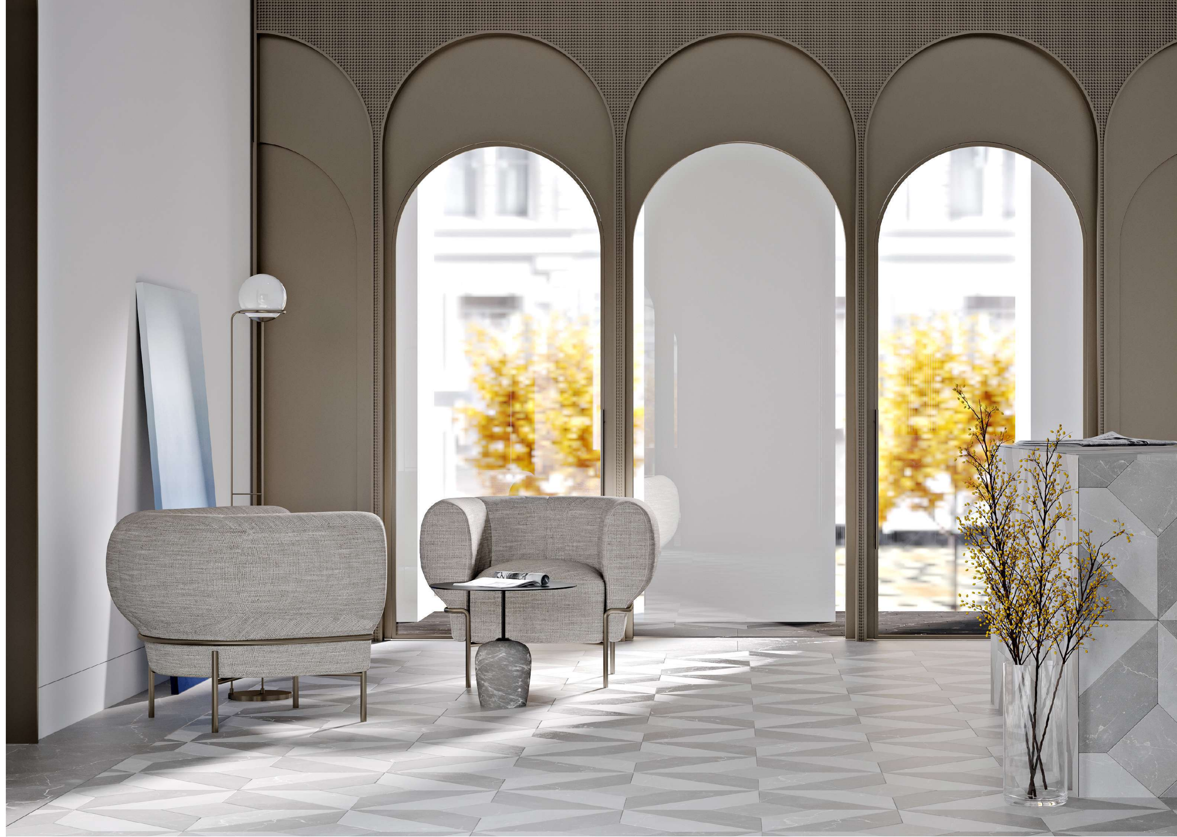
Лобби блока D